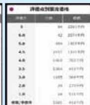
評価点別落流価格