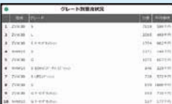
グレード別落流状況